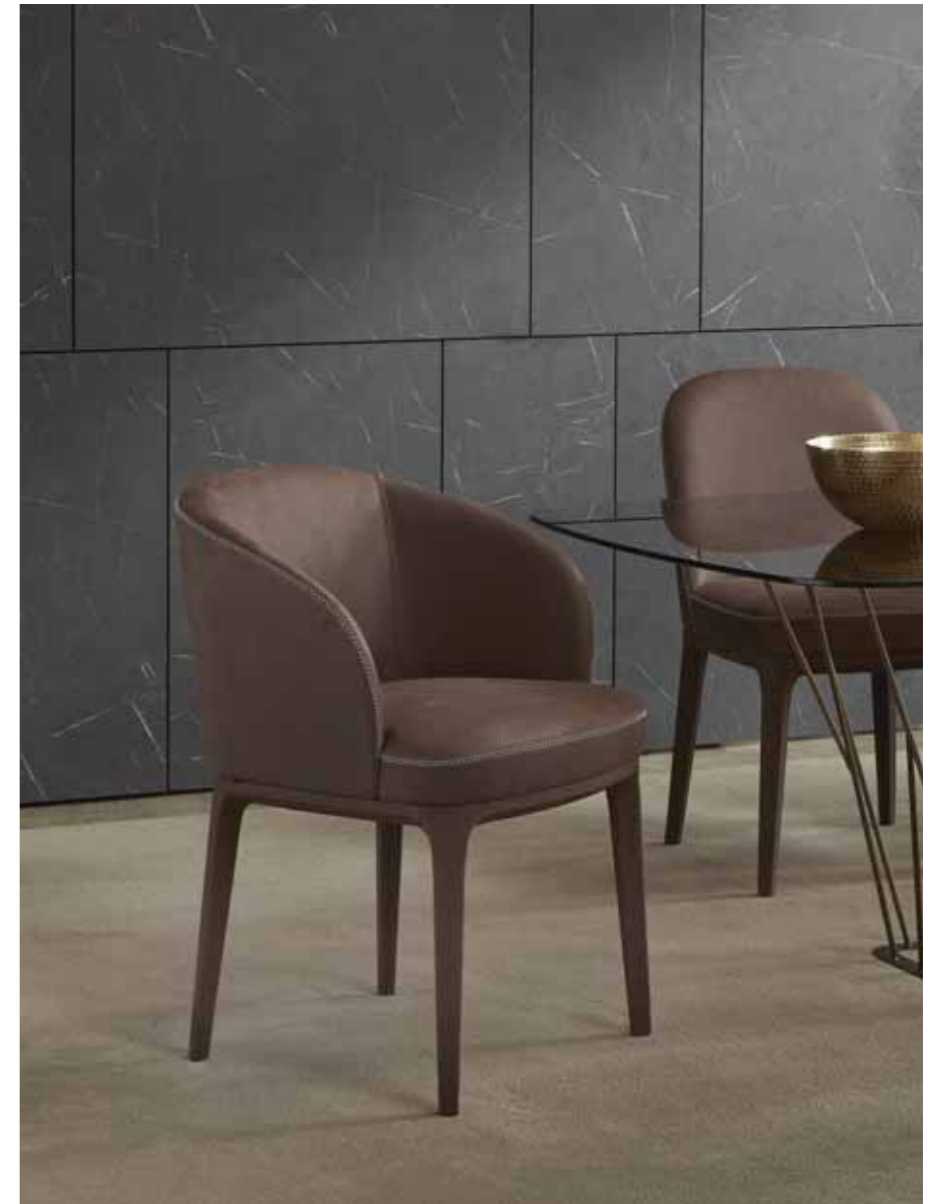
PARIS small armchair 9PAR103 cm 59x61x83h Leather: cat. Lusso art. Seta col. Ebano, with "X Stitching" Base: covered in the same leather