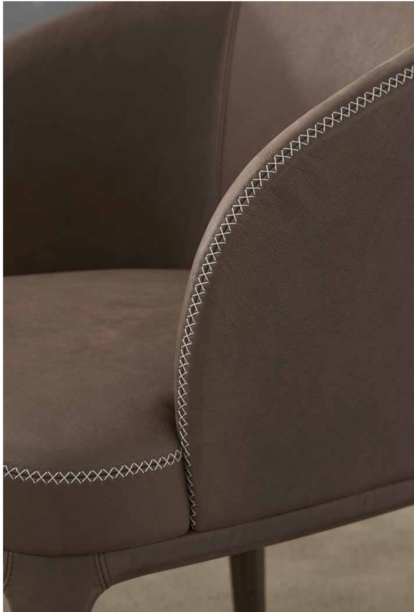
Detail of "X Stitching"