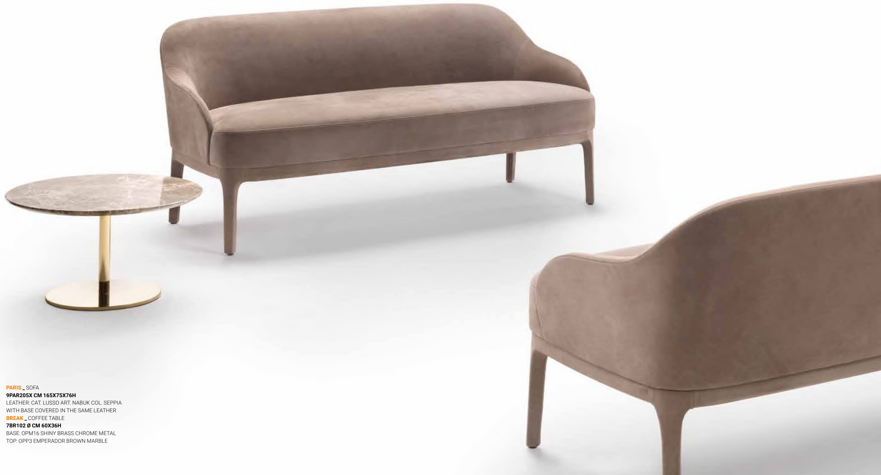
PARIS _ SOFA 9PAR205X CM 165X75X76H LEATHER: CAT. LUSO ART. NABUK COL. SEPIA WITH BASE COVERED IN THE SAME LEATHER BREAK _ COFFEE TABLE 7BR102 Ø CM 60X36H BASE: OPM16 SHINY BRASS CHROME METAL TOP: OPP3 EMPERADOR BROWN MARBLE