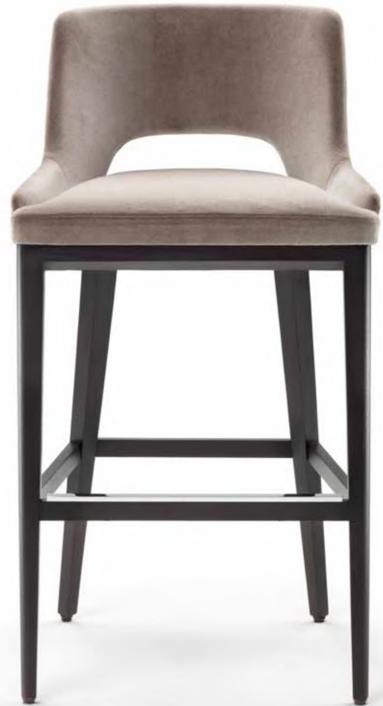
GRACE bar stools 9GR104 cm 53x56x99h Fabric: cat. H art. Rubelli Spritz col. 12 Tortora Base: OPR2 Wengè stained oak with OPM1 shiny chrome metal profile