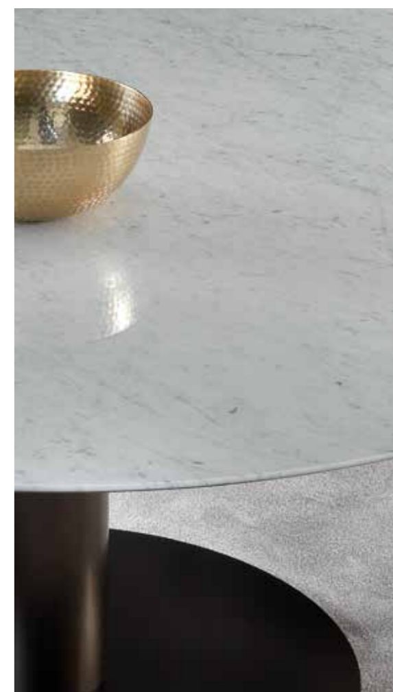
BREAK dining table 7BR220 \varnothing cm190x74h Base: OPM18 anodyc bronze painted metal | Top: OPP1 Carrara white marble GRACE chairs 9GR101 cm53x56x91h, 9GR102 cm56x56x91h Fabric: cat. H art. Sahco Kent col. 3 Base: OPR15 moka matt stained oak. Detail of Carrara marble top