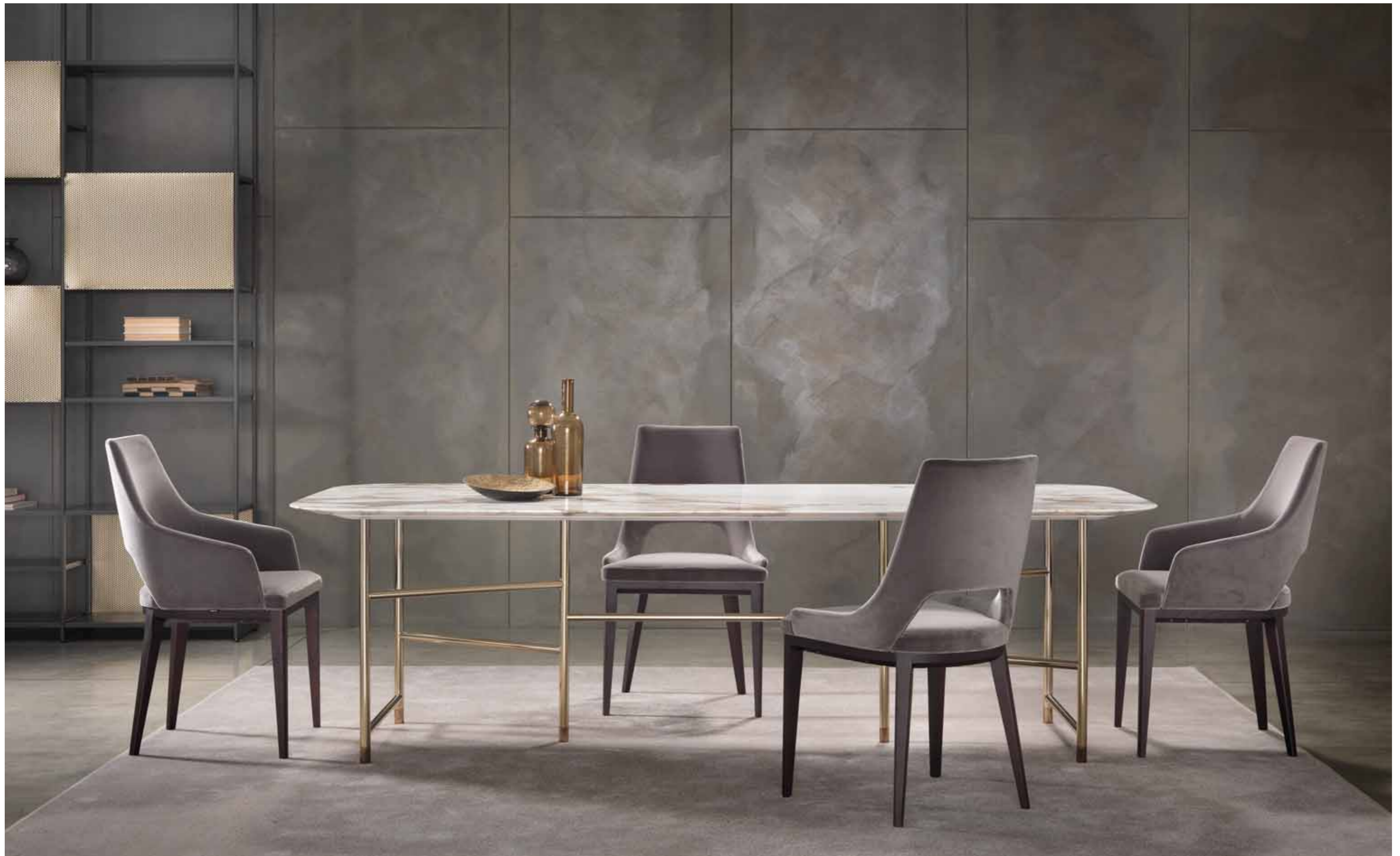
GRACE chairs 9GR101 cm 53x56x91h 9GR102 cm 56x56x91h Fabric: cat. G art. Misia Aime M188 310 col. 10 antracite Base: OPR5 black stained oak