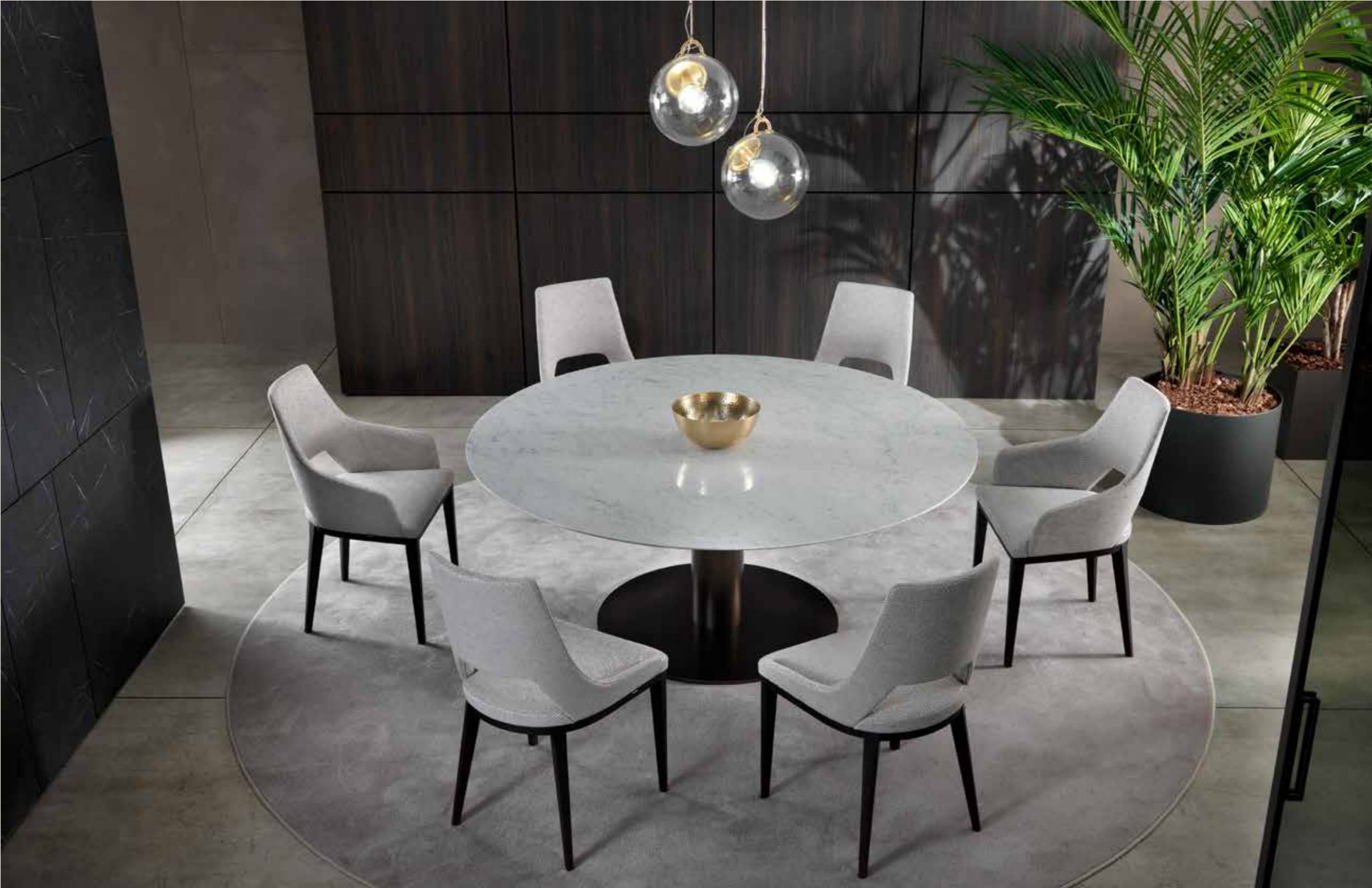
Break Dining Table | Grace

BREAK dining table 7BR220 øcm190x74h Base: OPM18 anodyc bronze painted metal | Top: OPP1 Carrara white marble GRACE chairs 9GR101 cm53x56x91h, 9GR102 cm56x56x91h Fabric: cat. H art. Sahco Kent col. 3 | Base: OPR15 moka matt stained oak