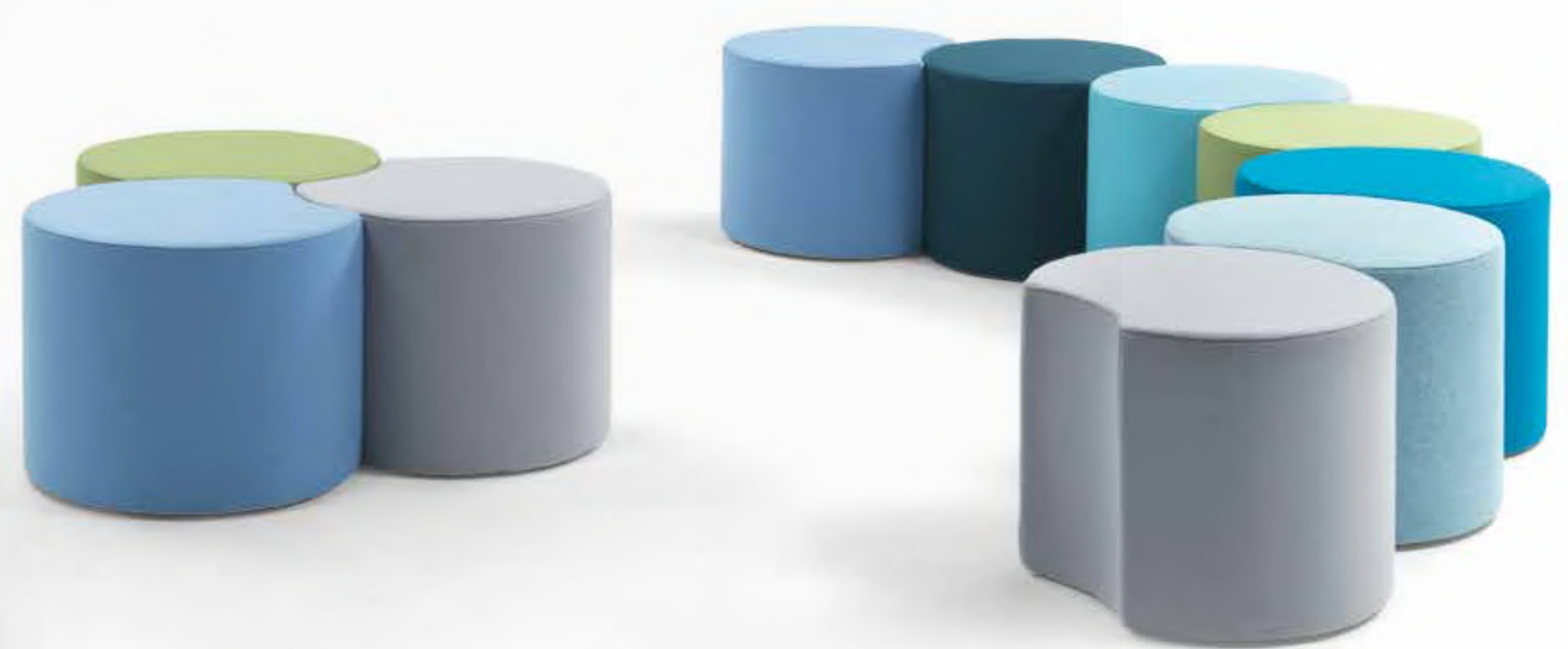
APP _ OTTOMANS 9APP101 Ø CM 50X40H FABRIC: CAT. E ART. CAMIRA BLAZER AND CAT. F ART. GABRIEL EUROPOST IN DIFFERENT COLOURS