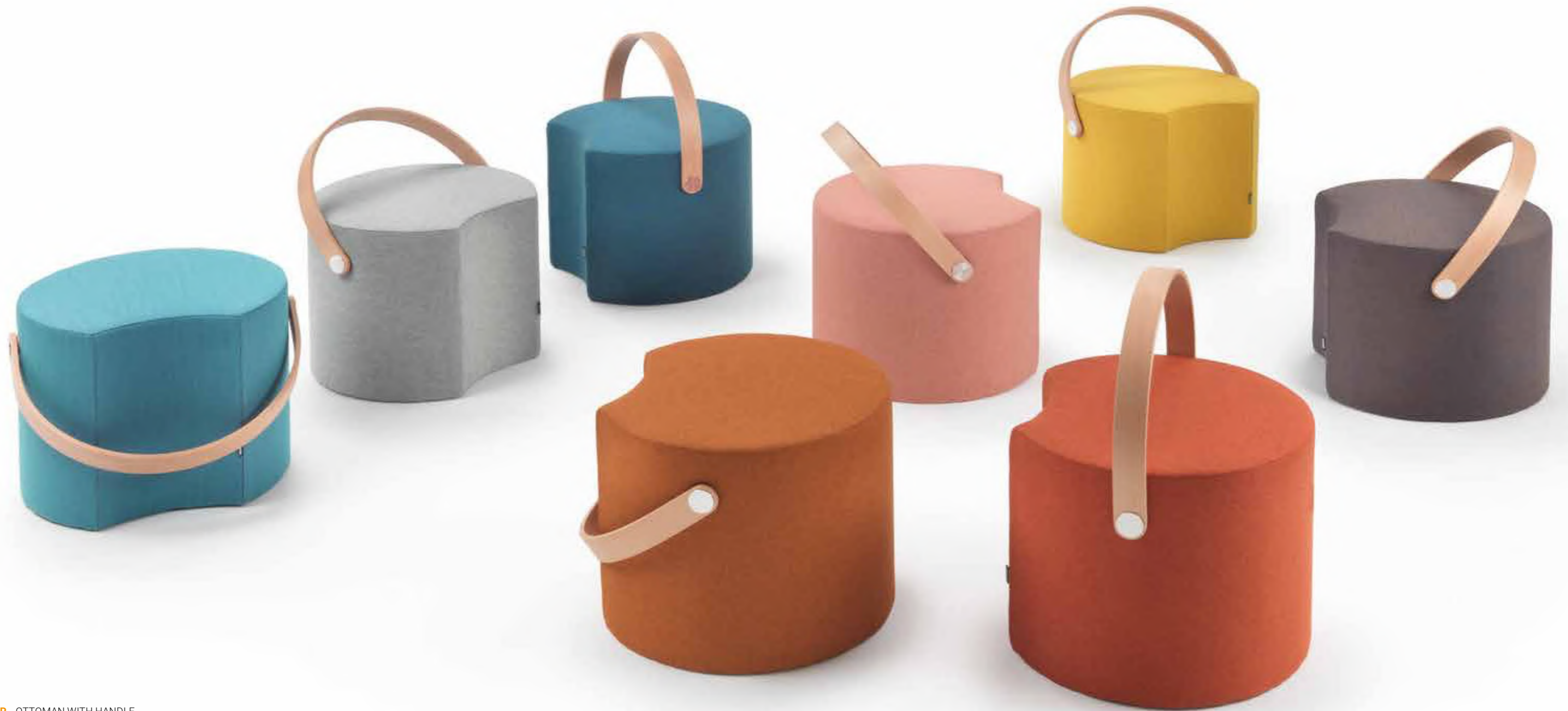
APP _ OTTOMAN WITH HANDLE 9APP102 Ø CM 50X40H IN DIFFERENT FABRICS OPR4 NATURAL OAK HANDLE