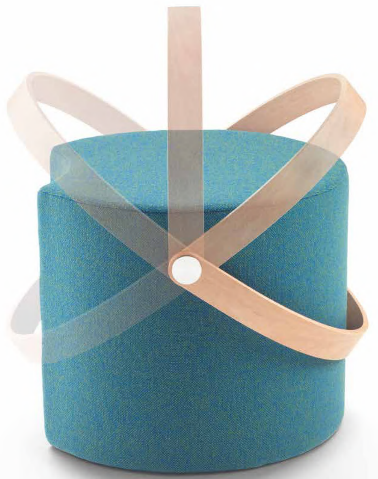
APP_ OTTOMAN WITH HANDLE 9APP102 Ø CM 50X40H IN DIFFERENT FABRICS OPR4 NATURAL OAK HANDLE