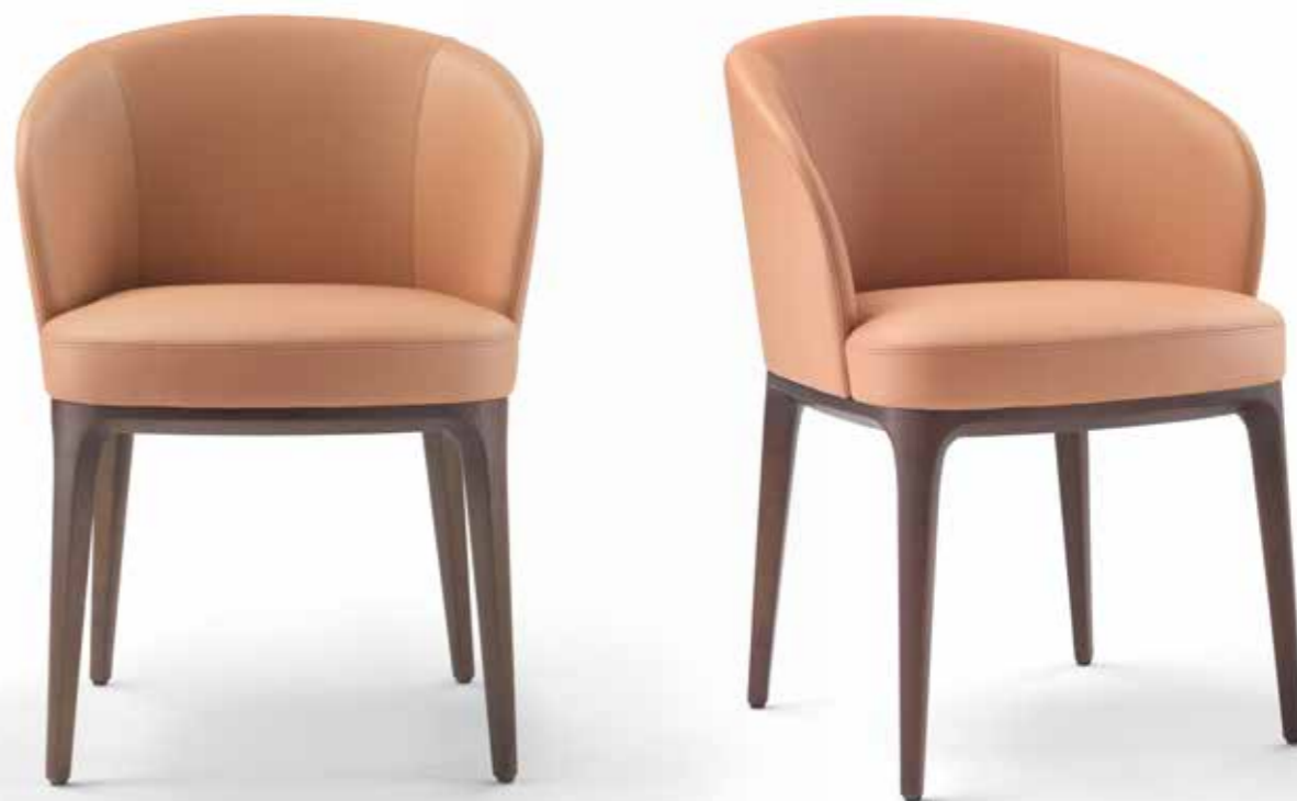
PARIS _ CHAIRS WITH ARMRESTS 9PAR103 CM 59X61X83H LEATHER: CAT. EXTRA ART. MANHATTAN 2070 BASE: OPR15 MOKA MATT STAINED OAK