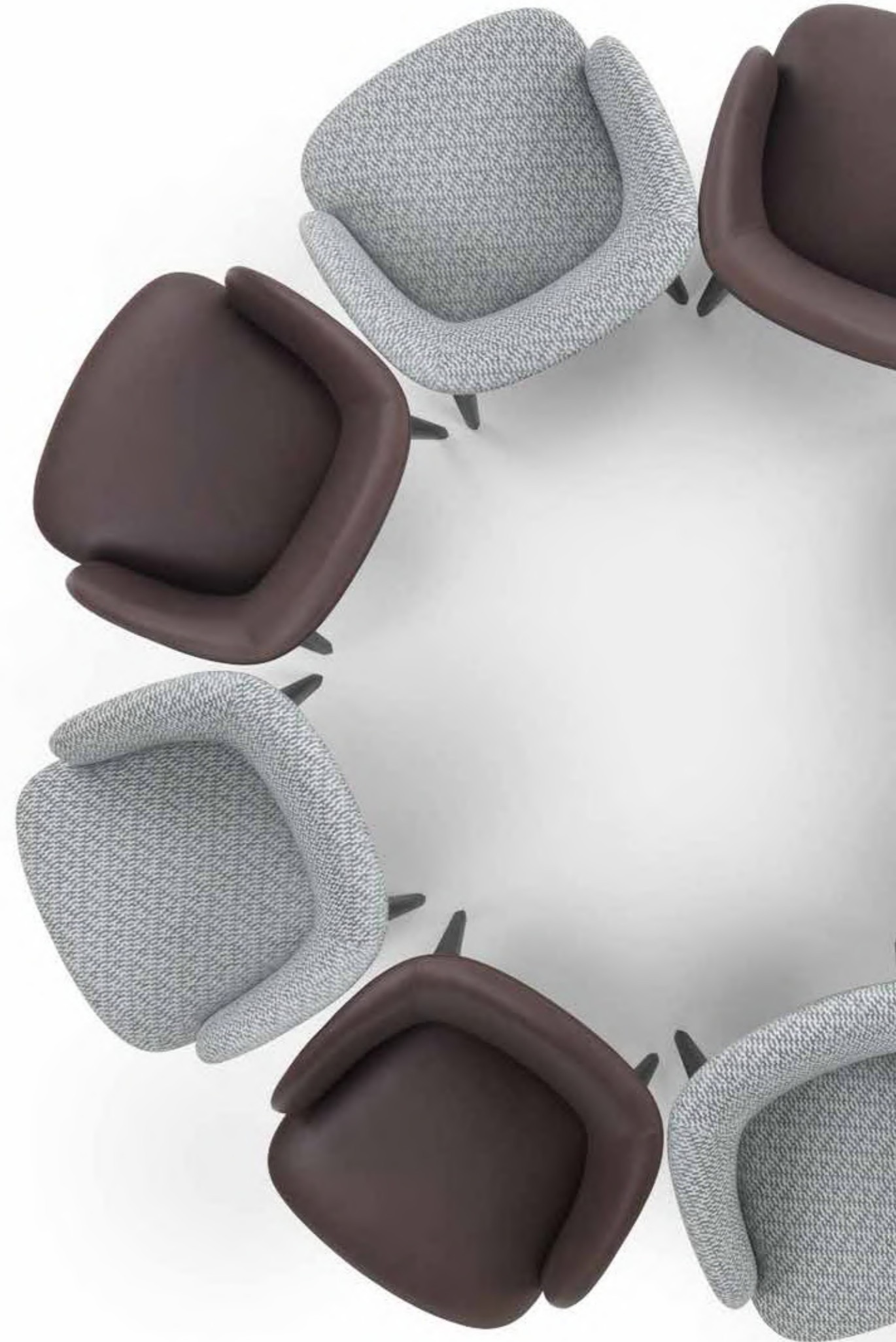
PARIS _ CHAIRS WITH ARMRESTS 9PAR103 CM 59X61X83H FABRIC: ROMO CALIDA DRAGONFLY 7883/05 BASE: OPR2 WENGÉ STAINED OAK PARIS _ CHAIRS WITH ARMRESTS 9PAR103 CM 59X61X83H LEATHER: CAT. SUPER ART. DOLLARO 7070 BASE: OPR2 WENGÉ STAINED OAK