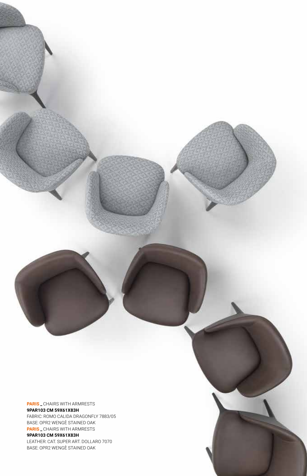
PARIS _ CHAIRS WITH ARMRESTS 9PAR103 CM 59X61X83H FABRIC: ROMO CALIDA DRAGONFLY 7883/05 BASE: OPR2 WENGÉ STAINED OAK PARIS _ CHAIRS WITH ARMRESTS 9PAR103 CM 59X61X83H LEATHER: CAT. SUPER ART. DOLLARO 7070 BASE: OPR2 WENGÉ STAINED OAK